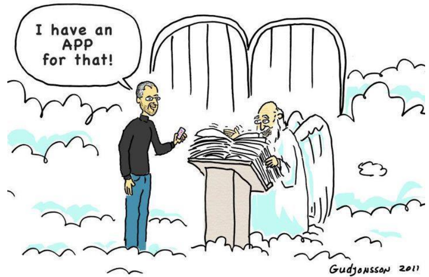
Steve Jobs, 1955 – 2011